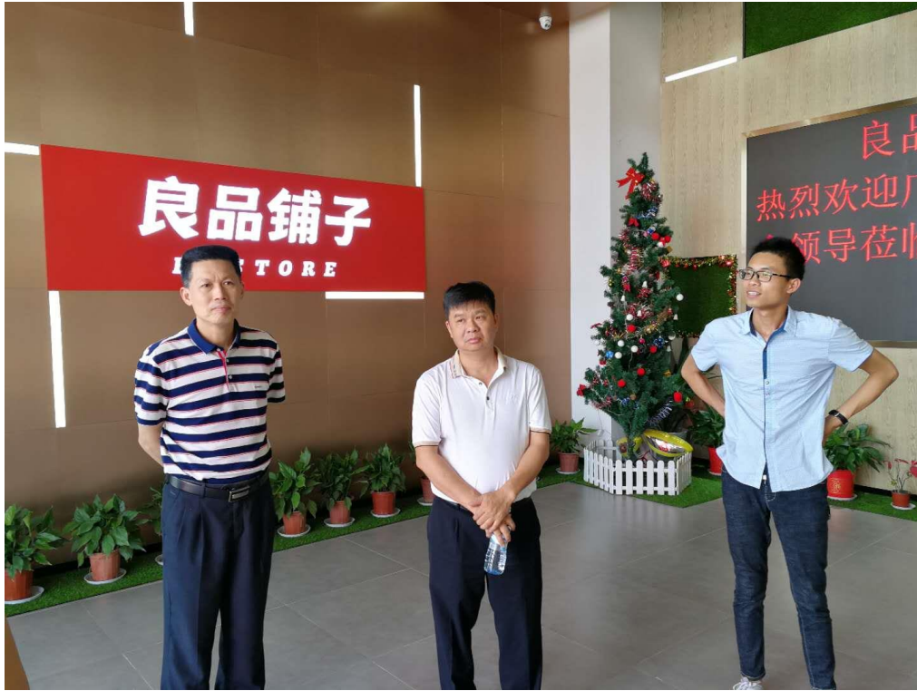
参观武汉市良品铺子物流中心