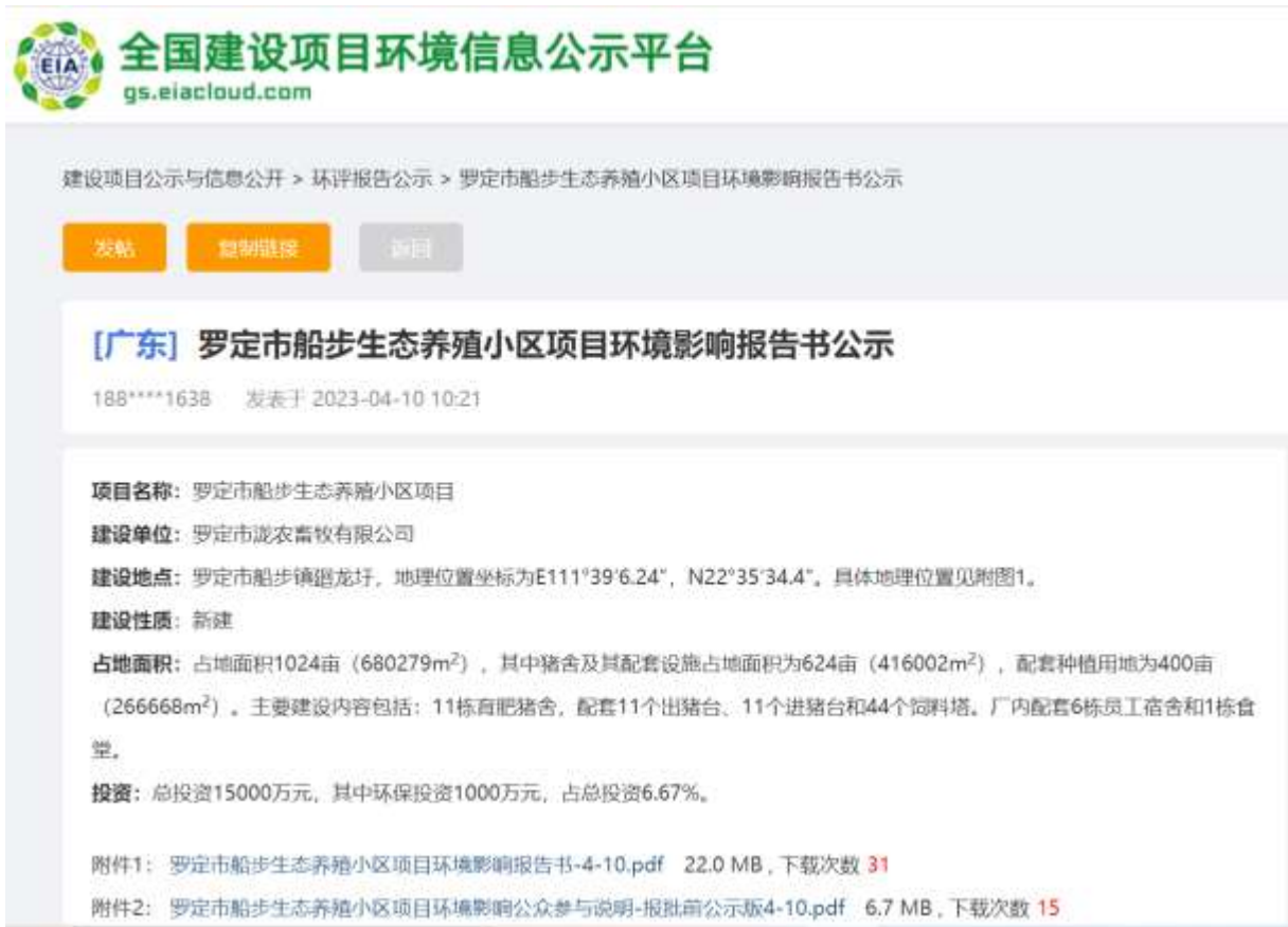
图5.1-1 报批前公示截图