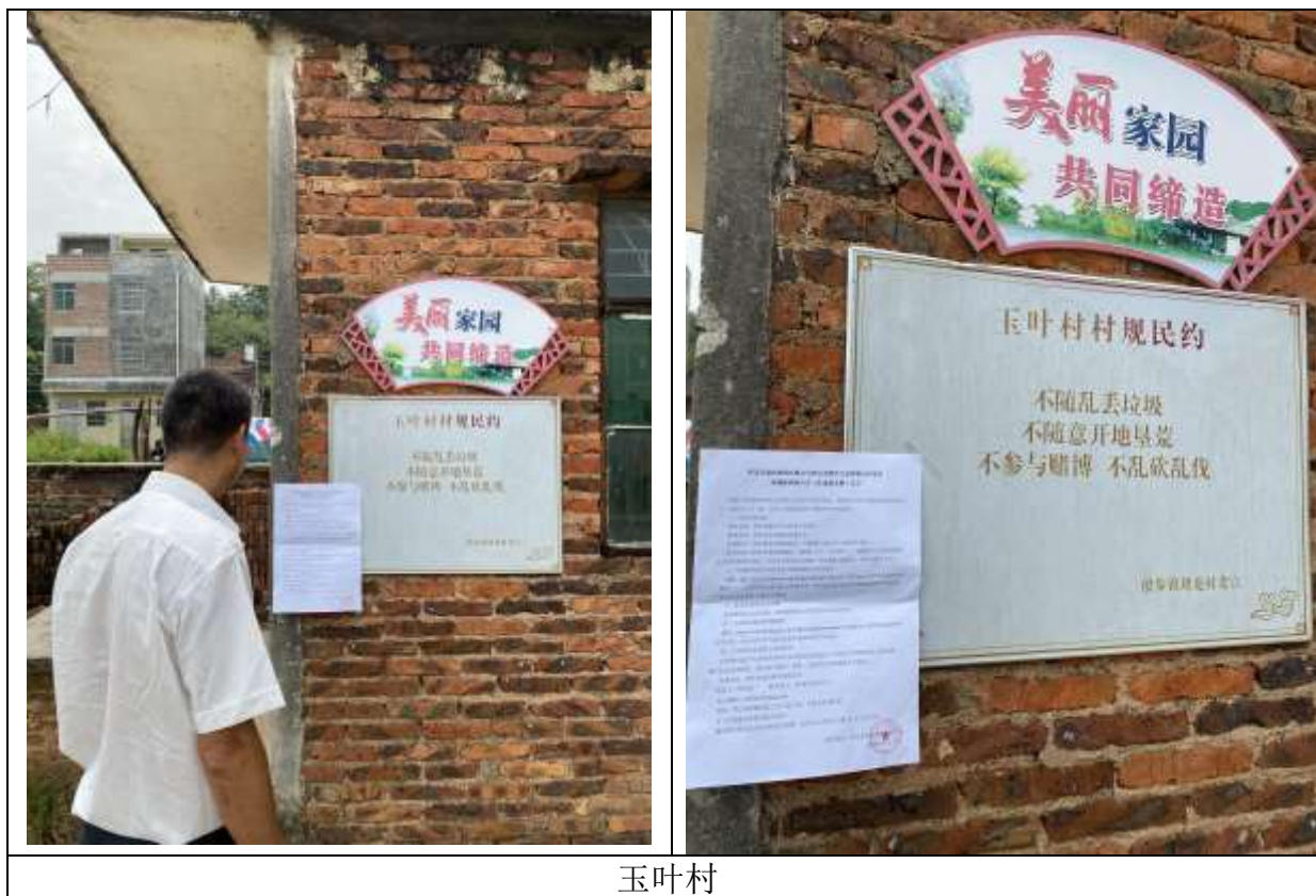
图4.2-4 征求意见稿公示现场张贴照片