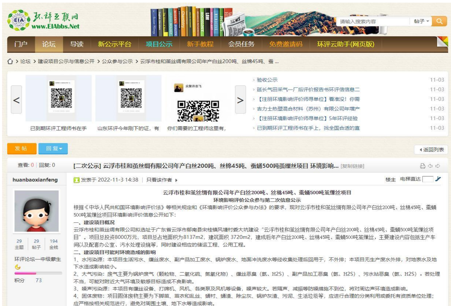
图 6.1-1 报批前网上公示截图