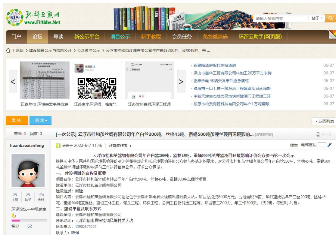
图 2.2-1 本项目首次环境影响评价信息公示截图