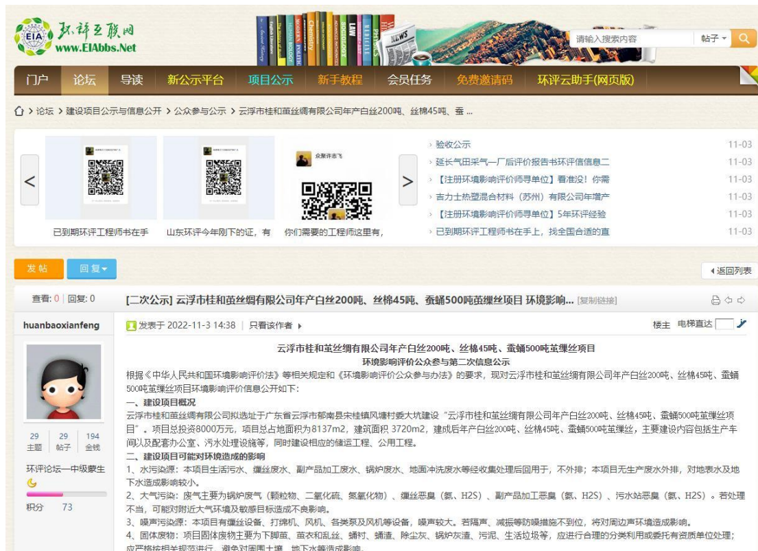
图 3.2.1 征求意见稿网上公示截图