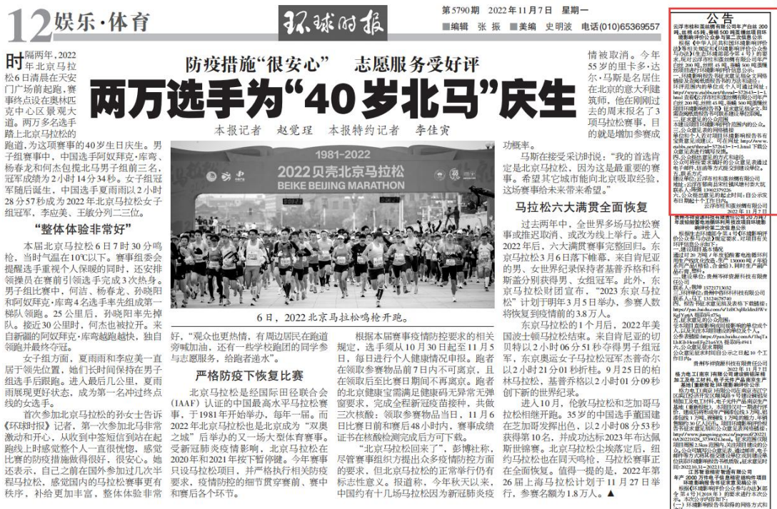
图3.2.2征求意见稿第一次登报公示照片

载体选取的符合性分析：本项目征求意见稿公示方式采用建设项目所在地且公众易于接触的报纸公开，且在征求意见的10个工作日内刊登征求意见稿公示信息2次，载体选取的符合《环境影响评价公众参与办法》要求。