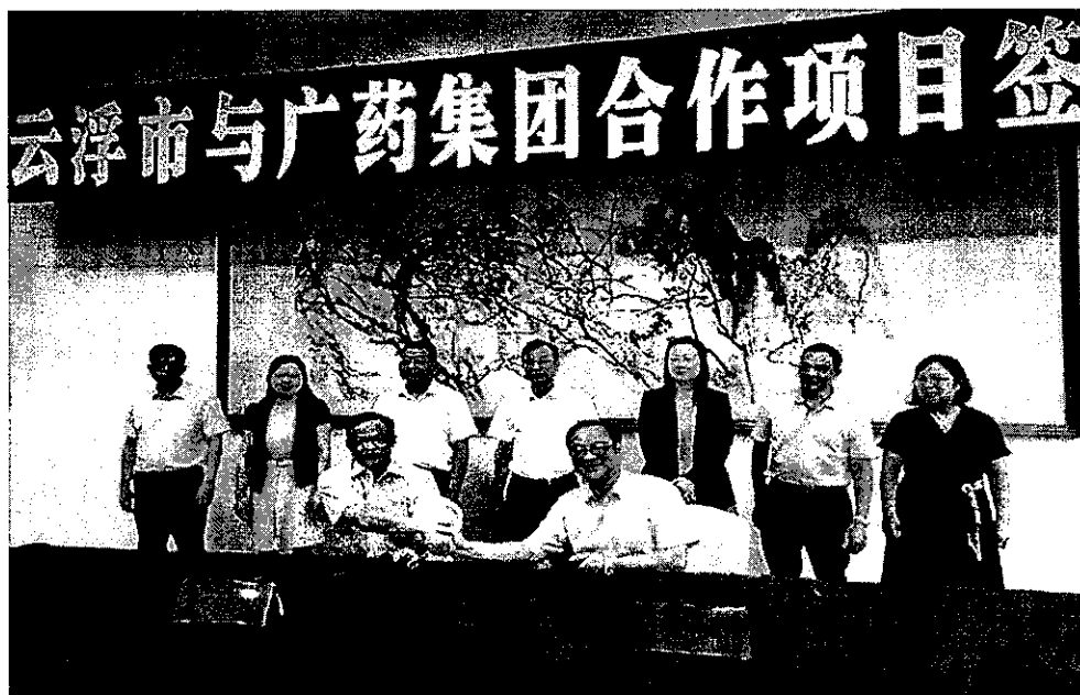
图 1. 与广药集团合作科研项目