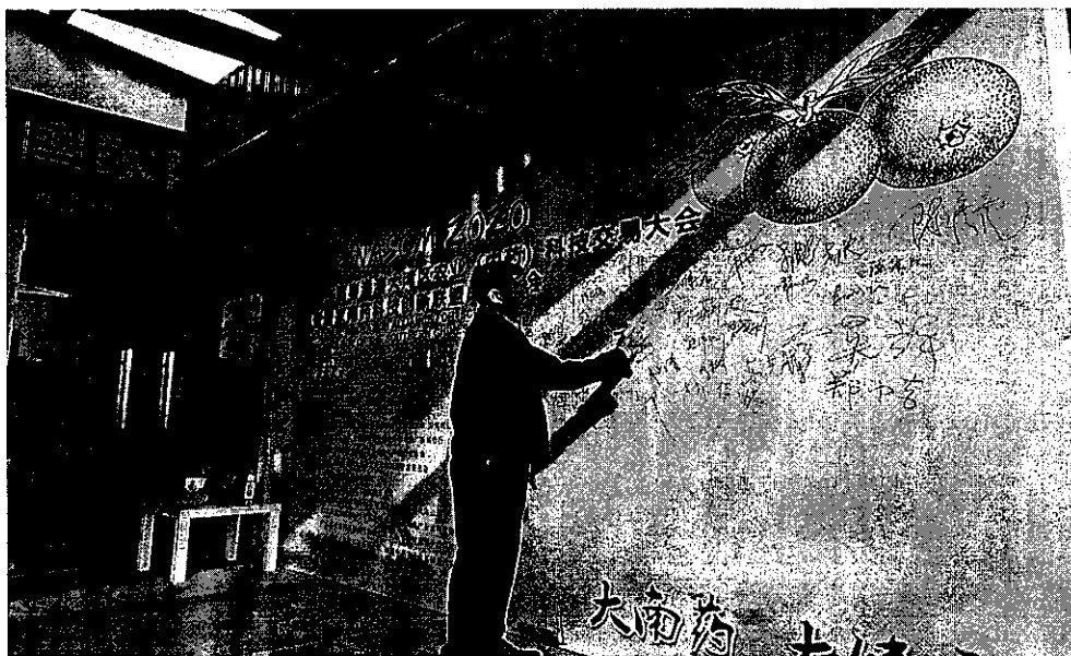
图 2. 加入国家南药科技创新联盟