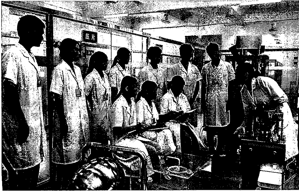
图 3: 校企共建模拟生产实训室内工学结合场景