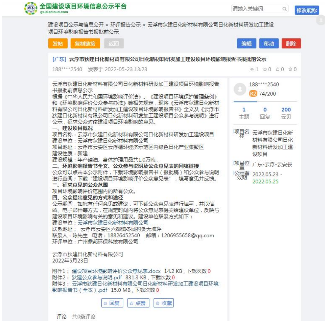
图 6-1 项目报批前公示截图