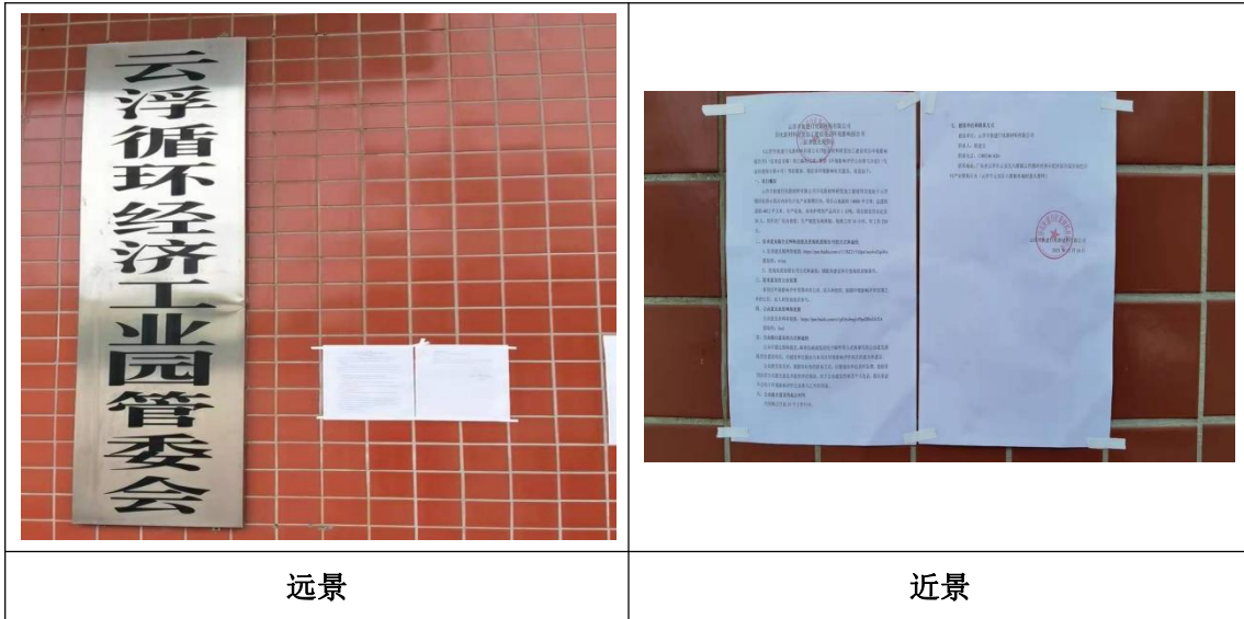
图 2-4 现场公示照片