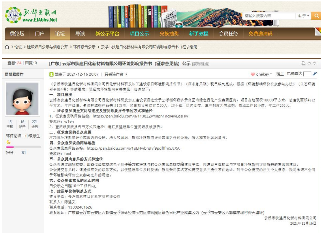
图 3-1 网络公示截图

载体选取的符合性分析： 本项目的征求意见稿在公众易于接触的环评互联网网站上进行公示，并在形成征求意见稿后，于 2021 年 12 月 16 日至 2021 年 12 月 29 日（10 个工作日）进行网上公示。因此本项目征求意见稿公示载体的选取符合《环境影响评价公众参与办法》要求。