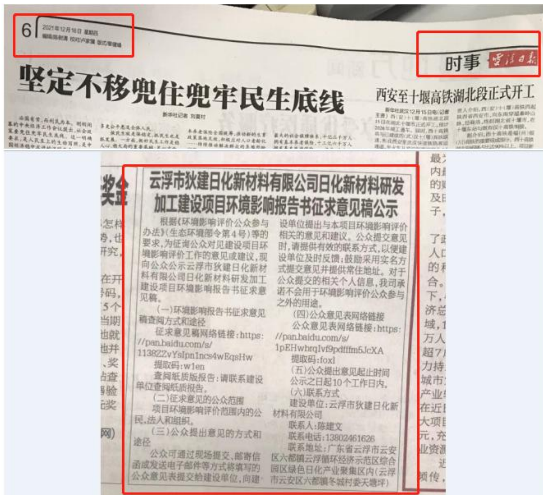
图 3-2 征求意见稿第一次登报公告照片

载体选取的符合性分析: 本项目位于云浮循环经济示范区内绿色日化产业集聚区内, 其征求意见稿公示方式采用建设项目所在地且公众易于接触的报纸《云浮日报》公开, 且在征求意见的 10 个工作日内刊登征求意见稿公示信息 2 次, 载体的选取符合《环境影响评价公众参与办法》的要求。