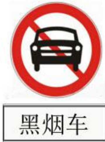
云浮市黑烟车禁行标志牌式样

黑烟车禁行标志牌主标为国家规定的“禁止机动车通行”禁令标志，下面辅以“黑烟车”等文字（式样见下图）。