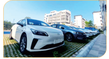
学生驾驶练习用车(部分)