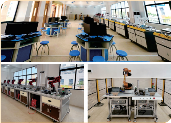
工业机器人实训室