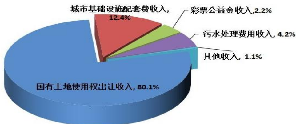
云浮市2023年1-12月政府性基金预算收入构成图

全市政府性基金预算支出 1,014,362 万元，增长 1.1%。其中：国有土地使用权出让收入安排的支出 153,875 万元，下降 23.88%；专项债务收入安排的支出 612,000 万元，下降 6.83%。